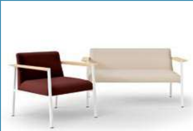
Lounge and conference chairs